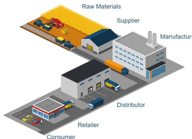
Figura 2 O prezentare simplă a unui lanț de aprovizionare-livrare 4

În Figura 2, se redă o succesiune simplă a componentelor unui lanț de aprovizionare-livrare, prezentat anterior, având în vedere distanțele reale (variabile) existente între firmele partenere.