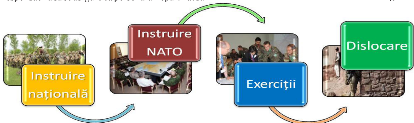
Fig. 2 Spectrul complet al utilizării sistemul e-learning

• e-ITEP – Electronic Individual Training and