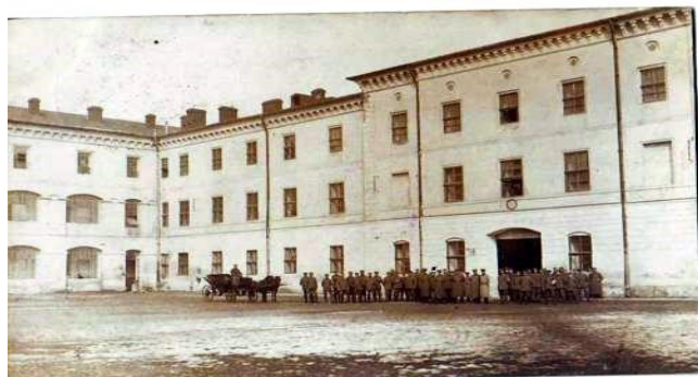
a – imagine din curtea interioară, fără an

Din informațiile acelei perioade, aflăm că mai întâi se realizau proiectele construcțiilor, apoi acestea erau analizate de statul major al armatei, care publica licitația. Antreprenorii particulari care