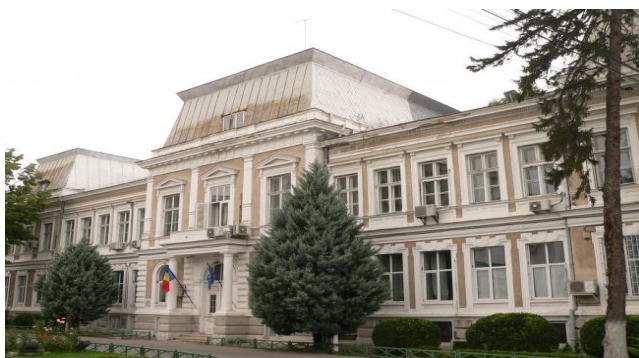
Figura 2. Clădirea Spitalului Militar Central, București