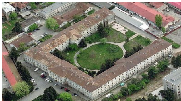
b – imagine actuală