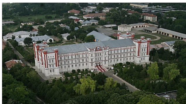
b – imagine din anii 2000