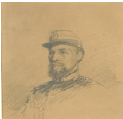
Portretul lui Ștefan Fălcoianu

Pornind de la discursul de inaugurare a Școlii Superioare de Război, rostit de întemeietorul acesteia, generalul Ștefan Fălcoianu 4 , în noiembrie 1889, potrivit căruia „Necesitatea creării unei Școli Superioare de Război a fost mult simțită și solicitată cu stăruință de Marele Stat Major al Armatei. (...) Vom pune toate silințele noastre spre a ne achita cu cel mai viu interes de această îndatorire; vom reclama, și suntem siguri că vom dobândi concursul camarazilor noștri cei mai luminați și, astfel, sperăm că, cu toții împreună, vom face ca această importantă instituțiune să dea roadele ce Armata așteaptă de la dânsa” 5 , putem concluziona acum, la ceas aniversar, după 130 de ani de efervescentă activitate, după schimbări și transformări de nume 6 , că vorbele mai sus amintite și-au atins, an după an, adevăratul sens.