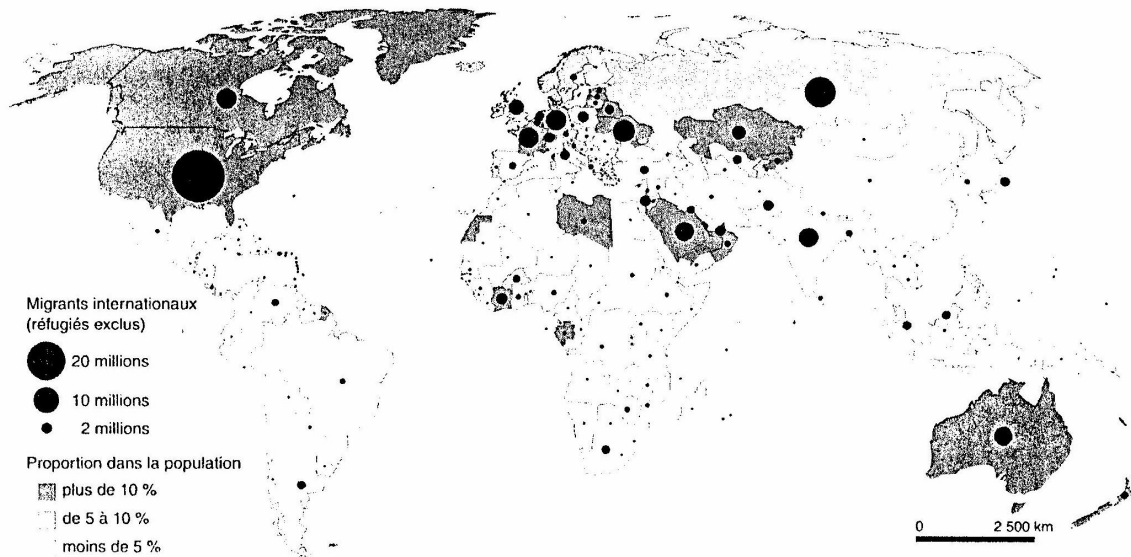
Carte 1.– Effectifs de migrants internationaux (réfugiés non compris) par pays de résidence en 2000

NB : sur la carte sont représentés les effectifs de migrants internationaux à l'exclusion des réfugiés, afin de distinguer les « immigrés » des réfugiés. Pour ce faire, a été soustrait du total des migrants estimés par les Nations unies le chiffre correspondant de réfugiés provenant du HCR (à l'exception des données qui manquent pour Taiwan). Ces données sont désagrégées à l'échelle nationale et le pourcentage de la population immigrée par rapport à la population totale du pays de résidence a ainsi été calculé. Figurent en gris clair et foncé sur la carte les 64 États dont la population compte respectivement plus de 5 % et plus de 10 % de migrants internationaux.