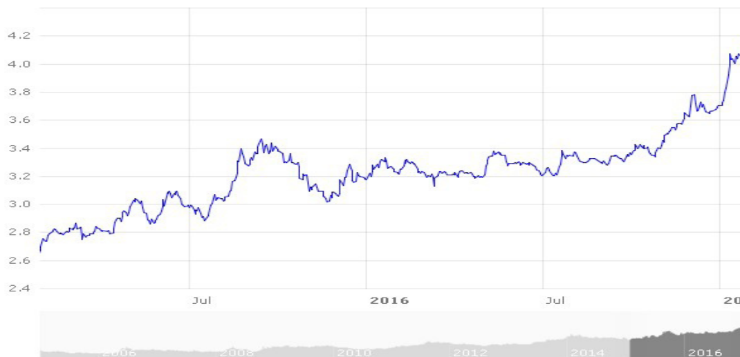
Fig. 1 Evoluția lirei față de euro în perioada ianuarie 2015- ianuarie 2017 9

Este cunoscut faptul că Turcia este o țară cu numeroase obiective istorice, frecvent vizitate de către turiștii din întreaga lume. Totodată, relieful acestei țări favorizează turismul. Turcia este înconjurată de patru mări având un litoral cu o lungime de 8.000 de km, iar în interior pot fi