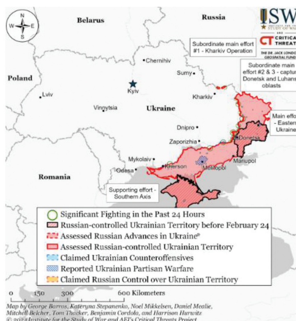
Figura 1 Controlul rusesc asupra teritoriului ucrainean

O victorie decisivă a Rusiei este puțin probabilă, având în vedere progresul războiului, totuși, am putea vorbi de aceasta în cazul ocupării totale sau a mai mult de jumătate din teritoriul ucrainean de către armata rusă, cu orașe mari, precum Harkov, Dnipro, Odessa sau chiar Kievul. Acest scenariu ar fi realizabil doar pe termen mediu sau lung, în urma unui intens război de uzură, în care Rusia ar reuși să elimine disponibilitatea țărilor occidentale, în special a Statelor Unite, de a sprijini Ucraina din punct de vedere militar. Astfel, și-ar confirma superioritatea numerică în militari, mijloace tehnice și capacitate de producție mai mare, în comparație cu inamicul, ducând astfel Ucraina la o înfrângere lentă, dar inexorabilă, sau chiar la o prăbușire completă a frontului de război.