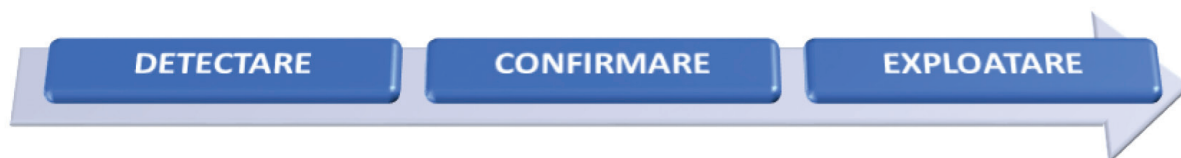
Figura 1 Procesul contracarării inducerii în eroare

Detectarea acțiunilor înșelătoare ale adversarului presupune identificarea incongruențelor operaționale privind modul de operare al acestuia, incluzând eventuale lacune suspecte, contradicții cu unele modele operate anterior, dar și confirmări care pot părea dubioase. Totuși, având în vedere că „nicio imitație nu poate fi perfectă, decât dacă este realitatea” ( Jones 1989 ), ar trebui să existe indicii