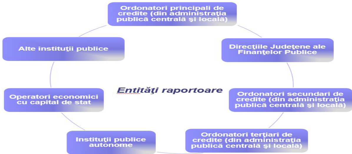
Fig. 2 Entitățile raportoare în cadrul sistemului informațional național

bugetare de angajament pentru a evalua valoarea contractelor încheiate, urmărirea arieratelor etc.; • centrul de greutate al activității derulate se va muta din zona de generare și colectare de date în