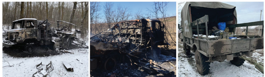
Figura 3 Camioane Gaz-66 distruse în ofensiva Rusiei împotriva Ucrainei, 2022