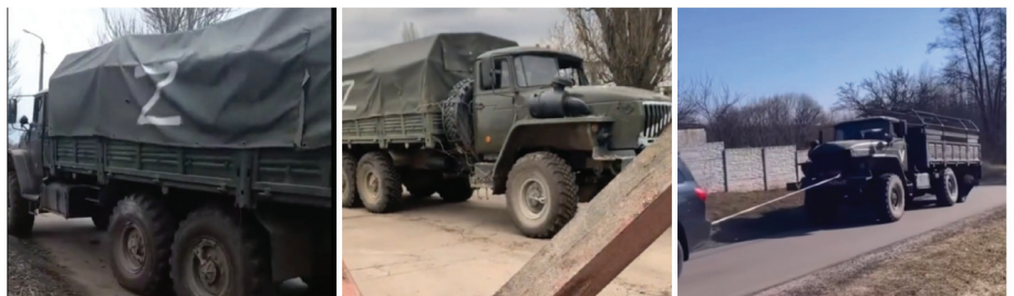
Figura 4 Camioane Ural-4320 66 distruse în ofensiva Rusiei împotriva Ucrainei, 2022

de o tracțiune 6x6, un autovehicul creat pentru executarea de misiuni cu caracter militar. A fost proiectat în anul 1966. Producția s-a oprit în 1994, fiind asamblate peste 1.000.000 de exemplare. Șasiul Zil-131 are o capacitate de transport de 5.000 de kilograme pentru deplasarea pe drum și 3.500 de kilograme, pe teren accidentat.