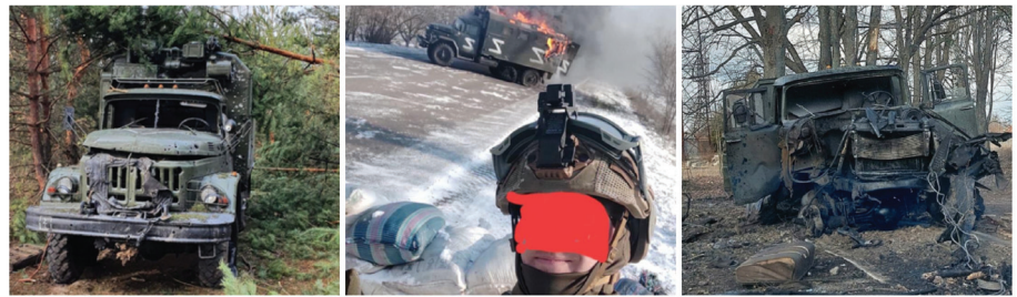
Figura 2 Camioane Zil-131 distruse în ofensiva Rusiei împotriva Ucrainei, 2022