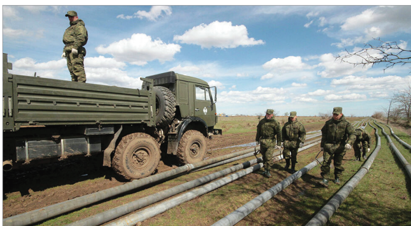
Figura 6 Militari ruși care deserveșc o structură militară, cu rolul asigurării de carburant, implementând infrastructura specifică