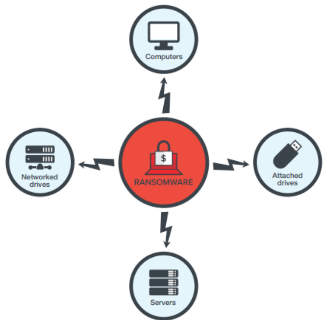
Figura 1 Modul de atac al ransomware (TrendMicro 2021)

În ultimul an, grupurile de criminalitate din Rusia și-au consolidat poziția de amenințări la adresa ecosistemului digital global, demonstrând adaptabilitate, persistență și dorința de a exploata sistemele informatice. Un atac de tip ransomware implică un software rău intenționat care implementează programe malware menite să cripteze și să exfiltreze date, păstrate în vederea unei răscumpărări, plata fiind adesea percepută în criptomonede. Mai mult decât atât, atacatorii exfiltrează date sensibile înainte de implementarea ransomware-ului pentru a împiedica victimele să se retragă de la negocieri. Potrivit statisticilor, actorii ransomware au trecut de la o abordare oportunistă cu volum mare la o metodologie mai selectivă în alegerea victimelor. Au crescut atacurile asupra sistemelor medicale, din cauza controalelor de securitate percepute ca fiind mai slabe și a tendinței