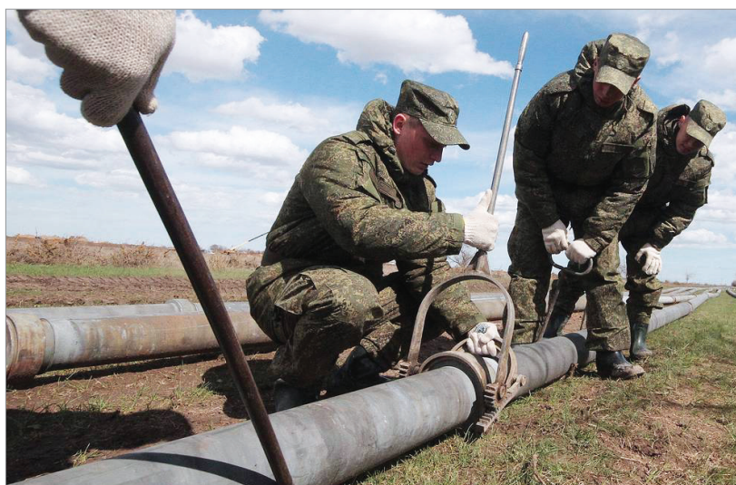
Figura 5 Militari ruși care deserveșc o structură militară cu rolul asigurării de carburant, implementând infrastructura specifică

O descriere sugestivă a Rusiei, care se aplică și în contextul actual, a făcut-o cancelarul german Otto von Bismarck (1815-1898), afirmând faptul că Rusia nu este niciodată atât de puternică sau atât de vulnerabilă pe cât lasă să se vadă.