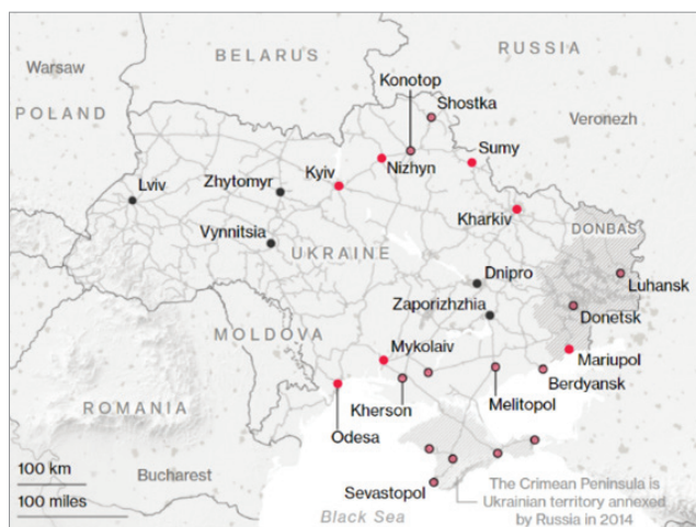
Figura 1 Harta Ucrainei

O analiză, întocmită de Gudrun Persson în Russian Military Capability in a Ten-Year Perspective 2016 , prezintă o situație a forțelor MTO, dispuse pe districte în teritoriul Rusiei. Observăm că, în districtul de vest al țării, se regăsesc 2 brigăzi logistice, 2 brigăzi pentru depozitare echipamente și 3 brigăzi dedicate infrastructurii feroviare, în raport cu districtul de est al Rusiei, unde sunt concentrate mai multe forțe care asigură sprijin logistic, ceea ce generează o posibilă cauză a deficienței în oferirea de sprijin logistic pentru Operația „Z” (Persson 2006, 70-71).