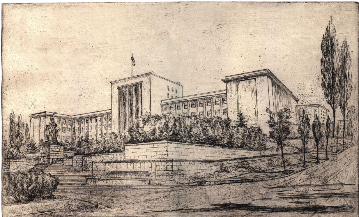
Universitatea Națională de Apărare „Carol I” Gravură realizată de Eugen Ilina, Uniunea Artiștilor Plastici din România