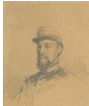
Portretul lui Ștefan Fălcoianu Gravură realizată de Nicolae Grigorescu, Biblioteca Academiei Române

Pornind de la discursul de inaugurare a Școlii Superioare de Război, rostit de întemeietorul acesteia, generalul Ștefan Fălcoianu, în noiembrie 1889, potrivit căruia „necesitatea creării unei Școli Superioare de Război a fost mult simțită și solicitată cu stăruință de Marele Stat Major al Armatei. (...) Vom pune toate silințele noastre spre a ne achita cu cel mai viu interes de această îndatorire; vom reclama, și suntem siguri că vom dobândi concursul camarazilor noștri cei mai luminați, și astfel, sperăm că, cu toții împreună vom face ca această importantă instituțiune să dea roadele ce Armata așteaptă de la dânsa” (Fălcoianu 1889, 764-765). Au avut loc schimbări și transformări de nume, iar vorbele mai sus amintite și-au atins, an după an, adevăratul sens.