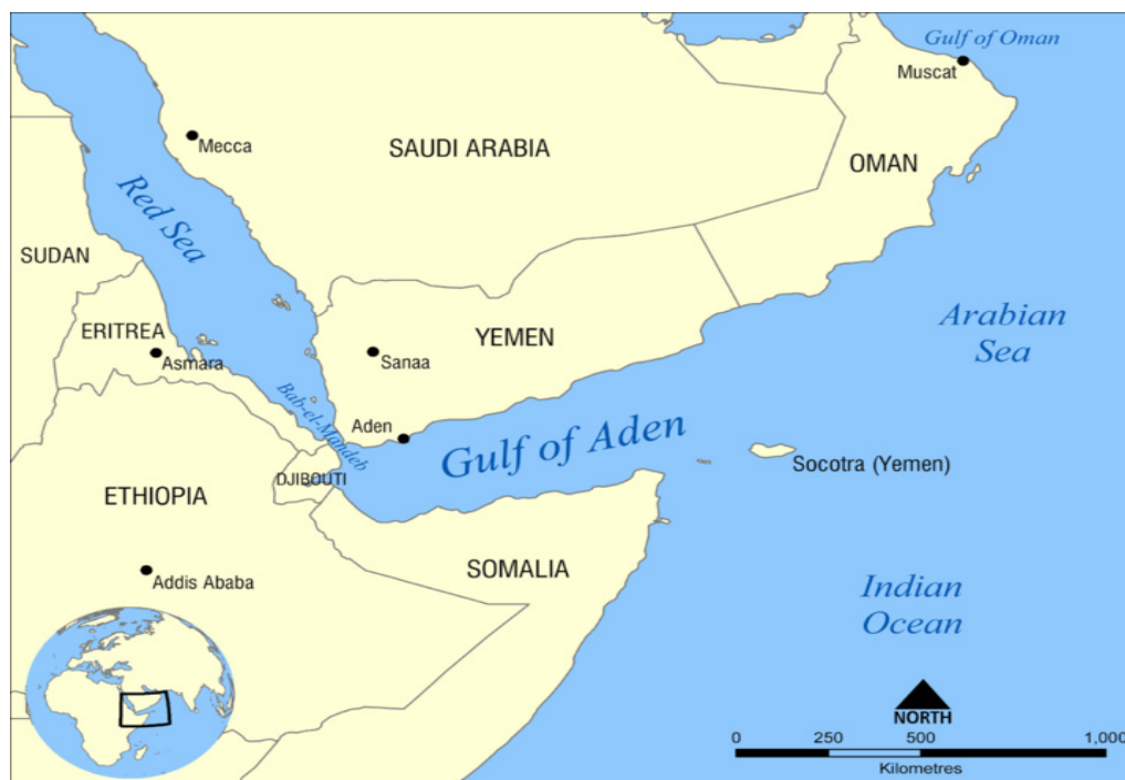
Figura 3 Golful Aden 26

strategice ar decupla Marea Mediterană de Oceanul Indian, obligând transportatorii să ocolească Africa prin dreptul Capului Bunei Speranțe (cu grave consecințe în plan economic, militar etc.). În anul 2018, aproximativ 6,2 milioane de barili de țiței pe zi și de produse petroliere rafinate au circulat prin punctul de constricție maritimă Bab el-Mandeb către Europa, Statele Unite și Asia. În 2017, fluxurile totale de petrol prin strâmtoarea Bab el-Mandeb au reprezentat aproximativ 9% din volumul petrolului comercializat pe mare la nivel global (țiței și produse petroliere rafinate) 27 .