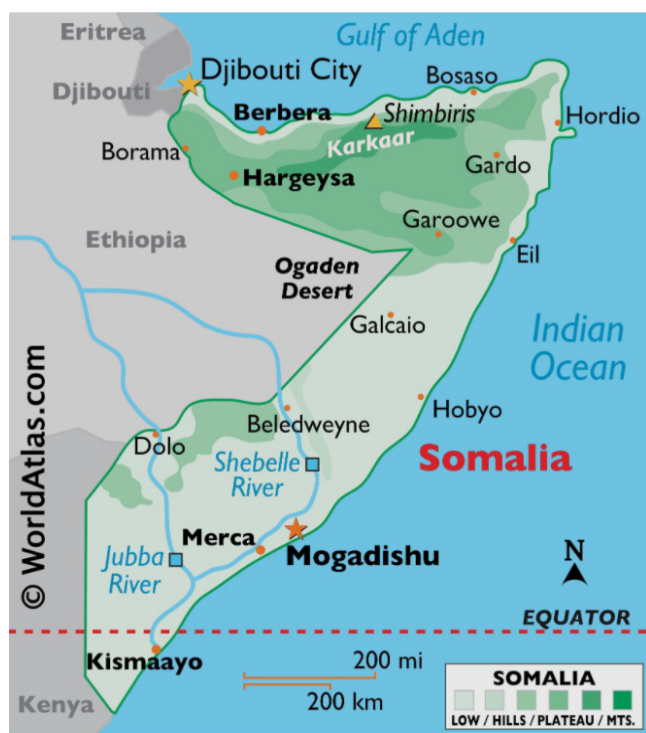
Figura 1 Harta fizico-geografică a Somaliei 8

Este un stat continental, cu forma alungită de-a lungul coastei, fără insule, nu prezintă enclave și nici nu deține exclave pe teritoriile altor state. Capitala